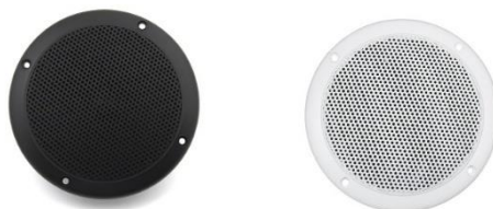
Рис. Внешний вид наружных динамиков